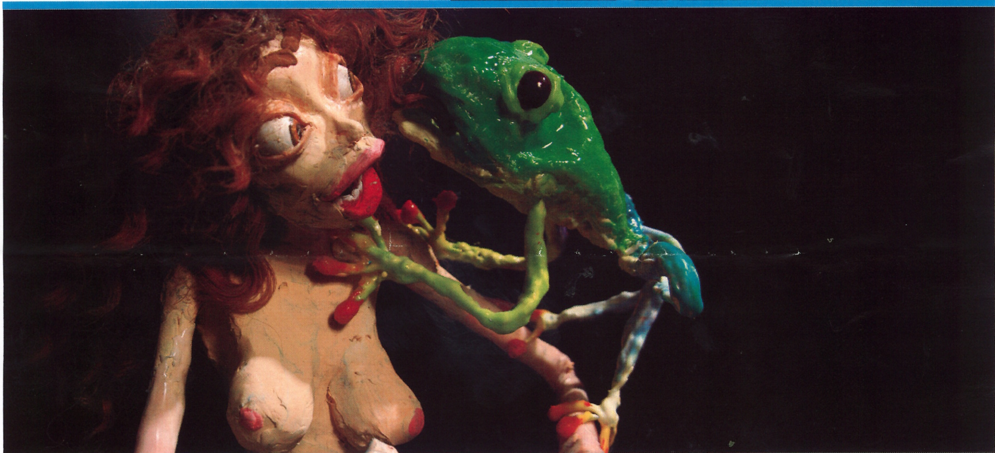
Bersærker gang. Svenske Natalie Djurberg har skabt sit helt eget grupvækkende, teatraliske og forførende univers af modellervoksdukker.