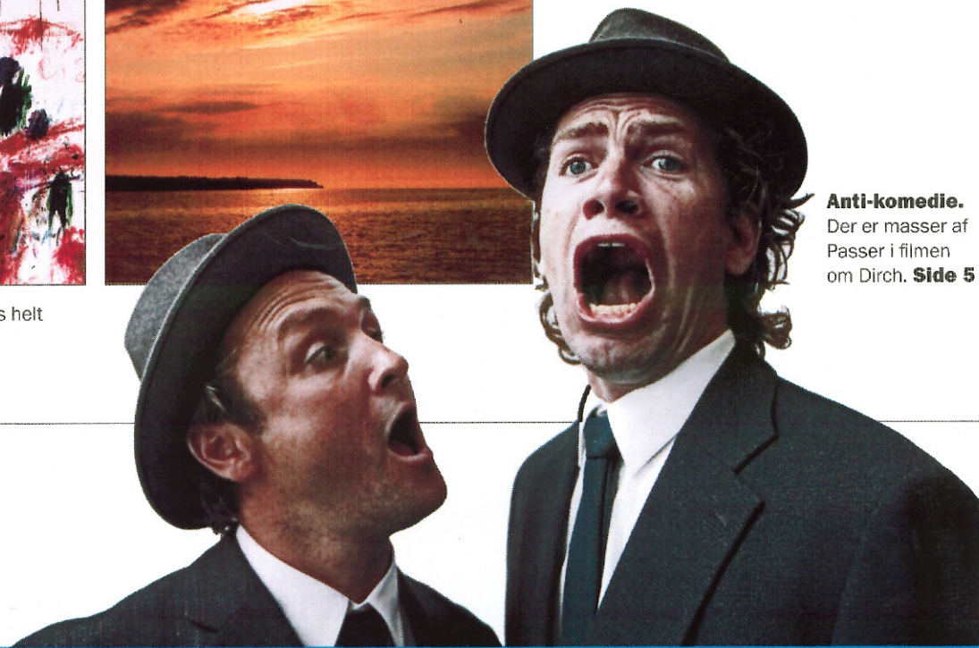
Anti-komedi. Der er masser af Passer i filmen om Dirch. Side 5