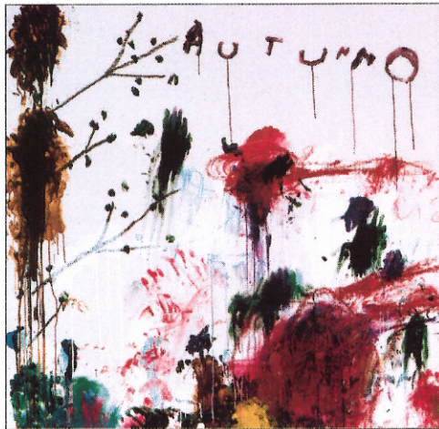
Cy Twombly. En af det 20. århundredes helt store kunstnere mindes. Side 10